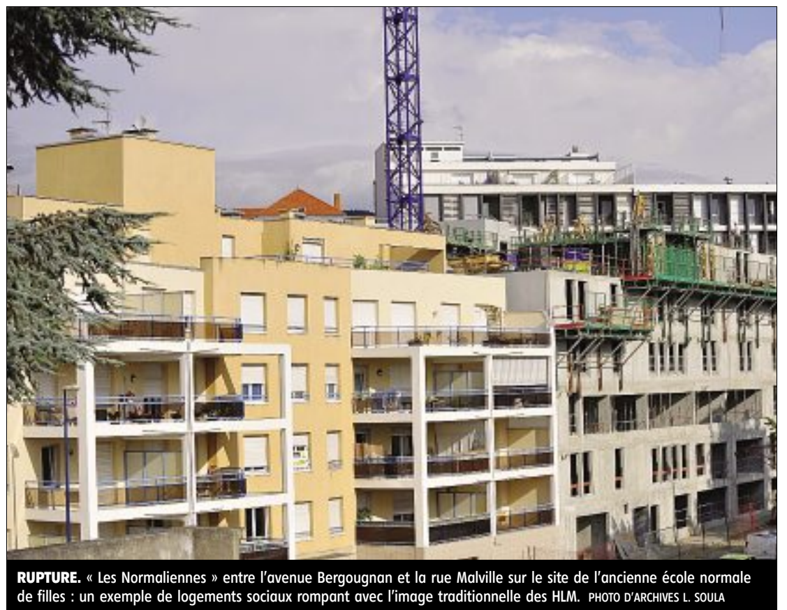
RUPTURE. « Les Normaliennes » entre l'avenue Bergougnan et la rue Malville sur le site de l'ancienne école normale de filles : un exemple de logements sociaux rompant avec l'image traditionnelle des HLM.