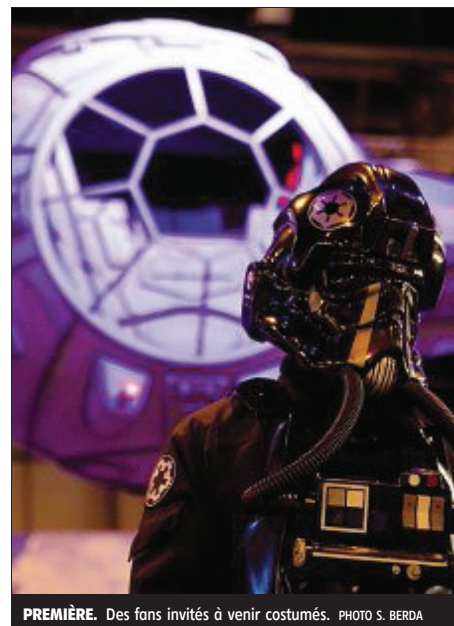
PREMIÈRE. Des fans invités à venir costumés.

Pour marquer le coup, les cinémas s'organisent aussi sur le mode événementiel. Le Ciné Jaude et le CGR Le Paris ouvriront exceptionnellement leurs portes dès 10 heures le mercredi 16 décembre. À Ciné Dôme, les fans sont